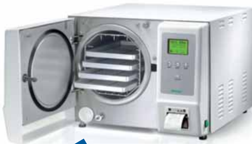
Autoclave KRONOS "B"

¡Ahora mejoramos oferta porque nos los exige el mercado!