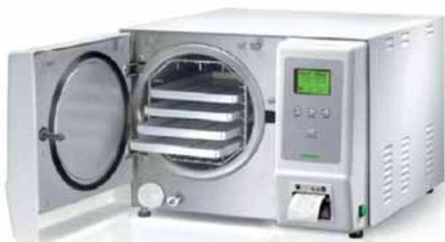
Autoclave KRONOS "B" 18 l.